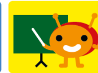
Surftipps für Lehrkräfte