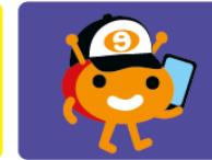
Surftipps für Jugendliche