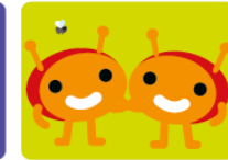
Surftipps für Eltern