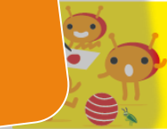
Surftipps für Kinder