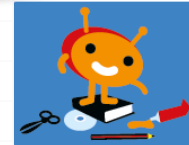
Surftipps für Erzieher/Innen