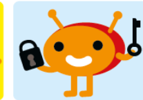
Datenschutz | Sicherheit | Recht